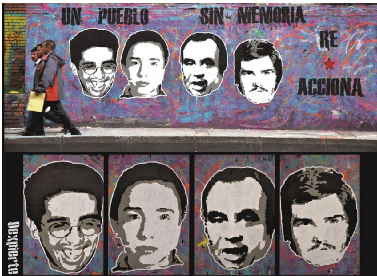
Fotografía 1: Colectivo Dexpierte

Quien dinamiza propone unas preguntas para motivar conversaciones individuales y colectivas: