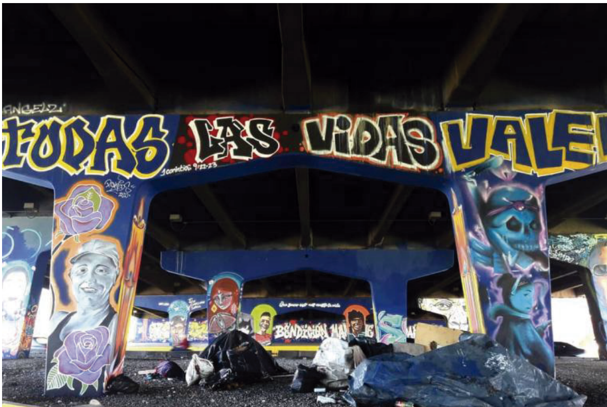
Fotografía 2: Todas las vidas valen Museo de Memoria al Aire Libre

Hace diez años, un grupo de jóvenes estudiantes de Sociología de la Universidad Nacional llegó hasta un muro de ladrillo en la Avenida Caracas de Bogotá. Con grafiti y estencil, los jóvenes dibujaron sobre el adobe, a punta de contornos muy negros y relleno blanco, las caras de Jaime Garzón, Nicolás Neira, Jaime Pardo Leal y Carlos Rodríguez. Los rostros de estas cuatro víctimas del conflicto armado quedaron retratados con aerosol, acompañados de la consigna “un pueblo sin memoria, ¡reacciona!”.