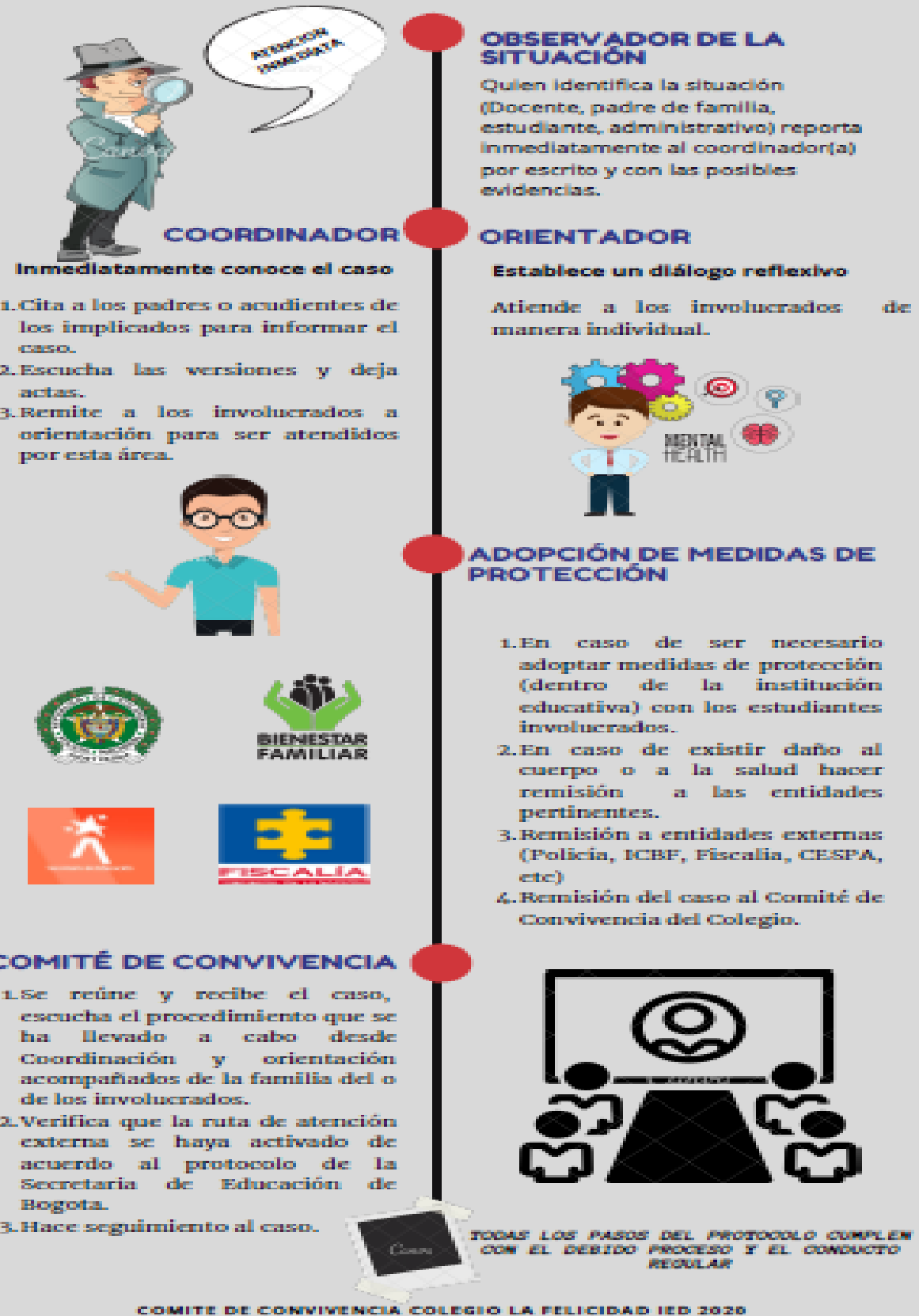
Imagen 2. Protocolos-Ruta de atención Integral a situaciones tipo III