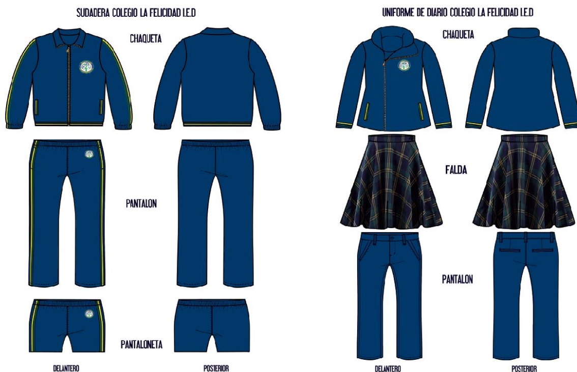
Imagen 1. Uniformes deportivos y de diario

Parágrafo 2. Grado 11 podrá incorporar a los uniformes de diario, gala y deportivo una chaqueta o buso distintivo, sin capota y en armonía con el uniforme de la Institución.