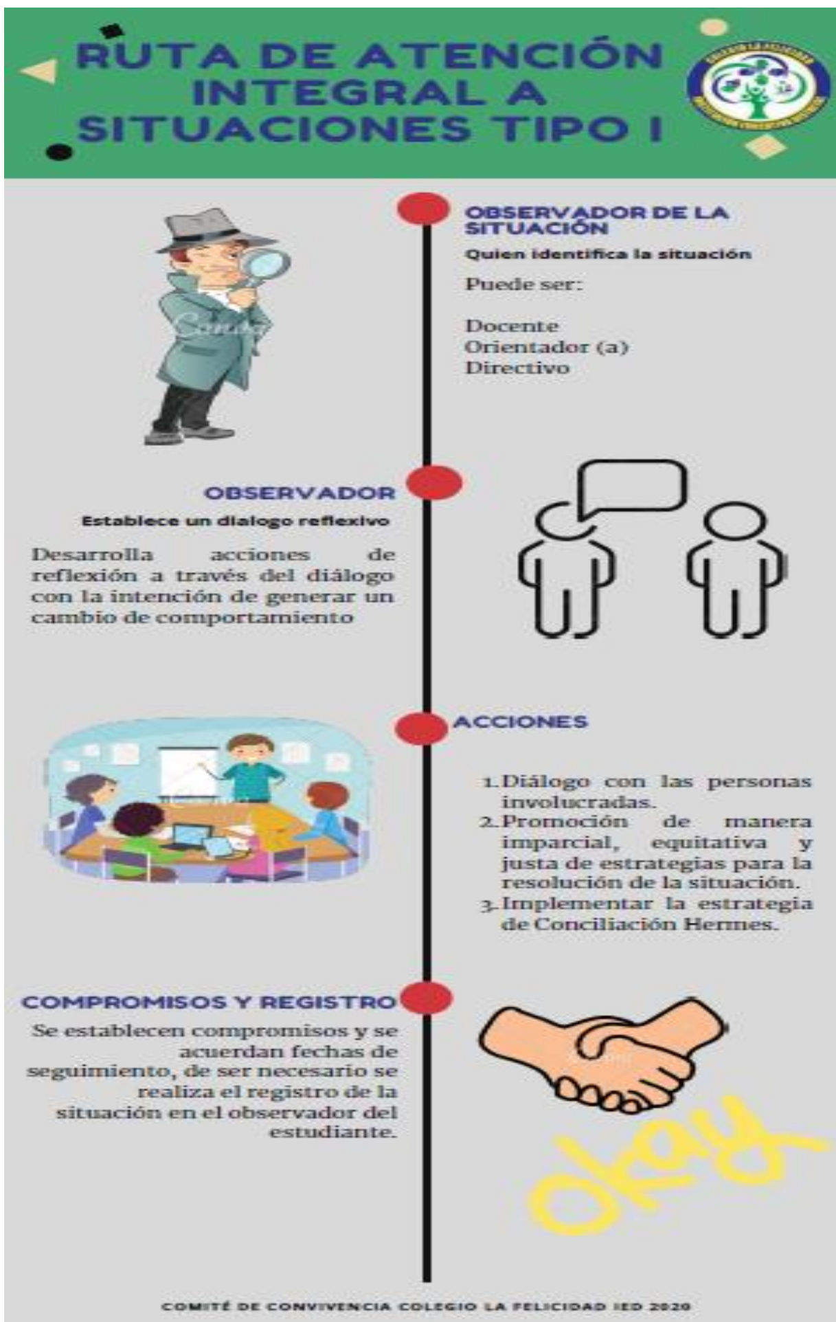
Imagen 2. Protocolos-Ruta de atención Integral a situaciones tipo I

Parágrafo 1. Estrategia de conciliación HERMES para la atención de Situaciones tipo I. De conformidad con la ruta de Atención Integral para la Convivencia, el Colegio La Felicidad IED establece como componente de promoción,