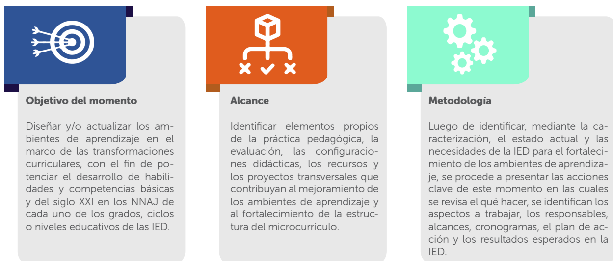
Gráfica 1. Aspectos momento ambientes de aprendizaje. Elaboración propia

A continuación, se describen los aspectos para tener en cuenta durante el abordaje de este momento: