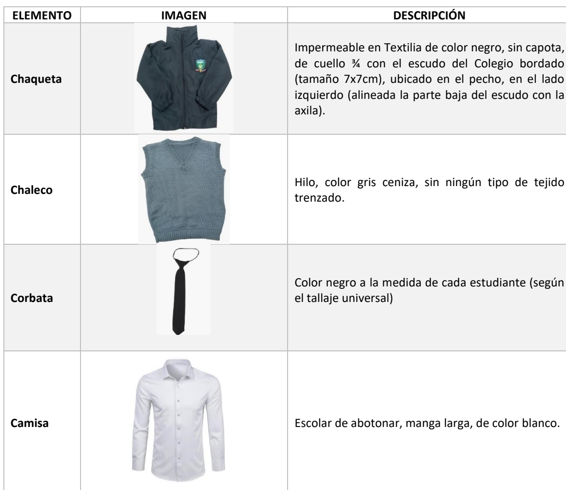
Tabla N° 4. Ficha técnica uniforme de diario.

A partir del año 2023 los estudiantes deberán asistir al Colegio portando el uniforme como se indica en el presente Manual: