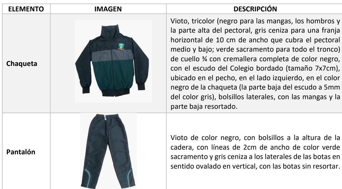
Tabla N° 5. Ficha técnica uniforme deportivo.