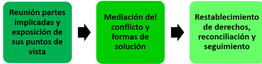
Imagen N° 1. Protocolo de atención para las faltas tipo I.