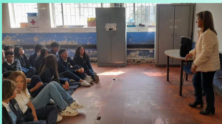
Sesión de meditación, para arrancar año académico con la mejor energía. (Febrero 24)