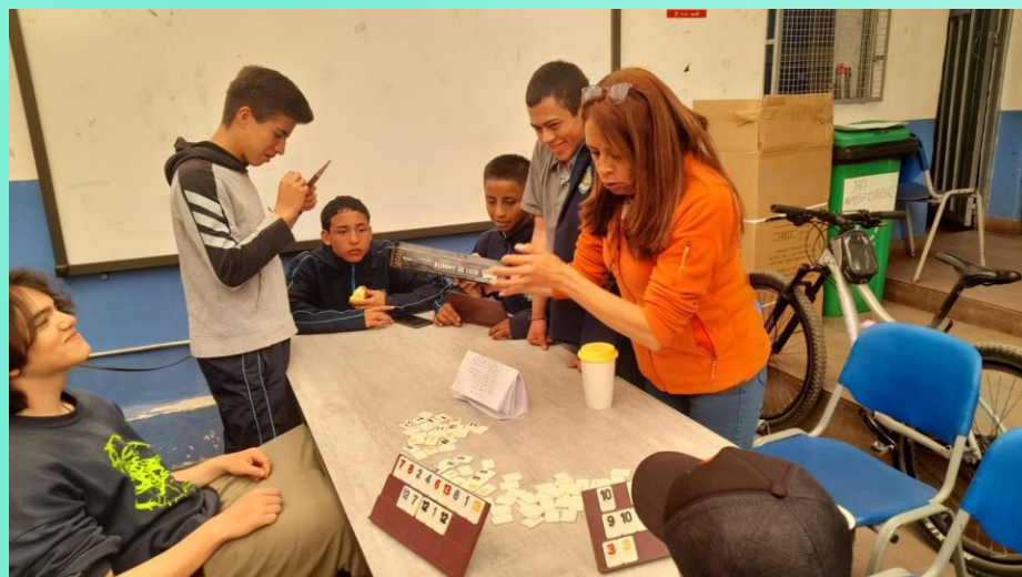
Trabajo de integración primera semana de inducción (Febrero 25)