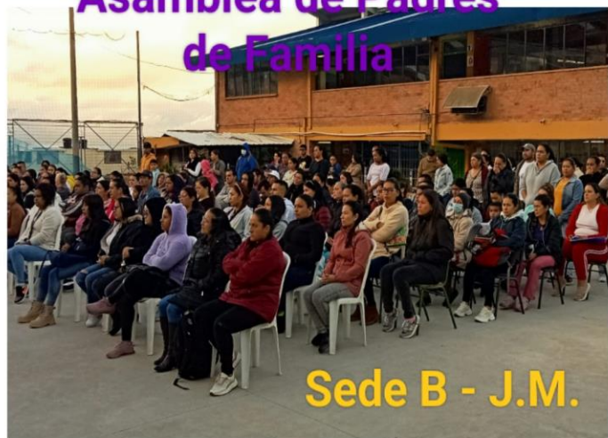
Sede B - J.M.