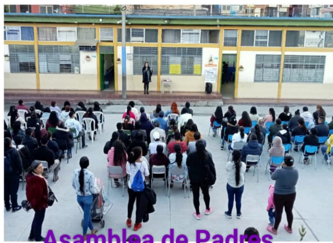
Asamblea de Padres de Familia