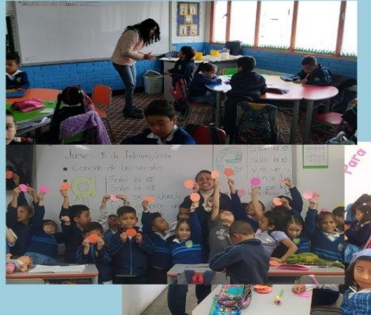
Socialización con los niños sobre el taller de padres