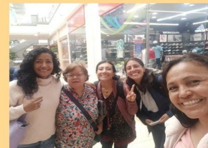
Reunión de orientadoras lunes 26 de febrero

26 Reunión equipo de orientación. JM/JT Taller emociones JM JM /JT Atención a acudientes. JT Taller estudiantes grupo focal.