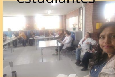
Reuniones con docentes sede A, Consejo Directivo.