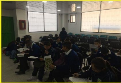
Talleres con estudiantes