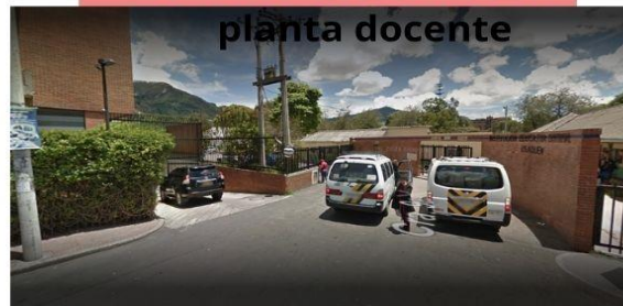
Reunión Direccion Local Mesa tecnica validacion planta docente