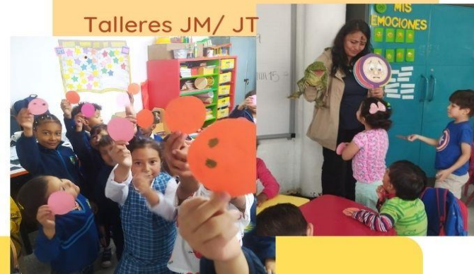
Talleres JM/ JT