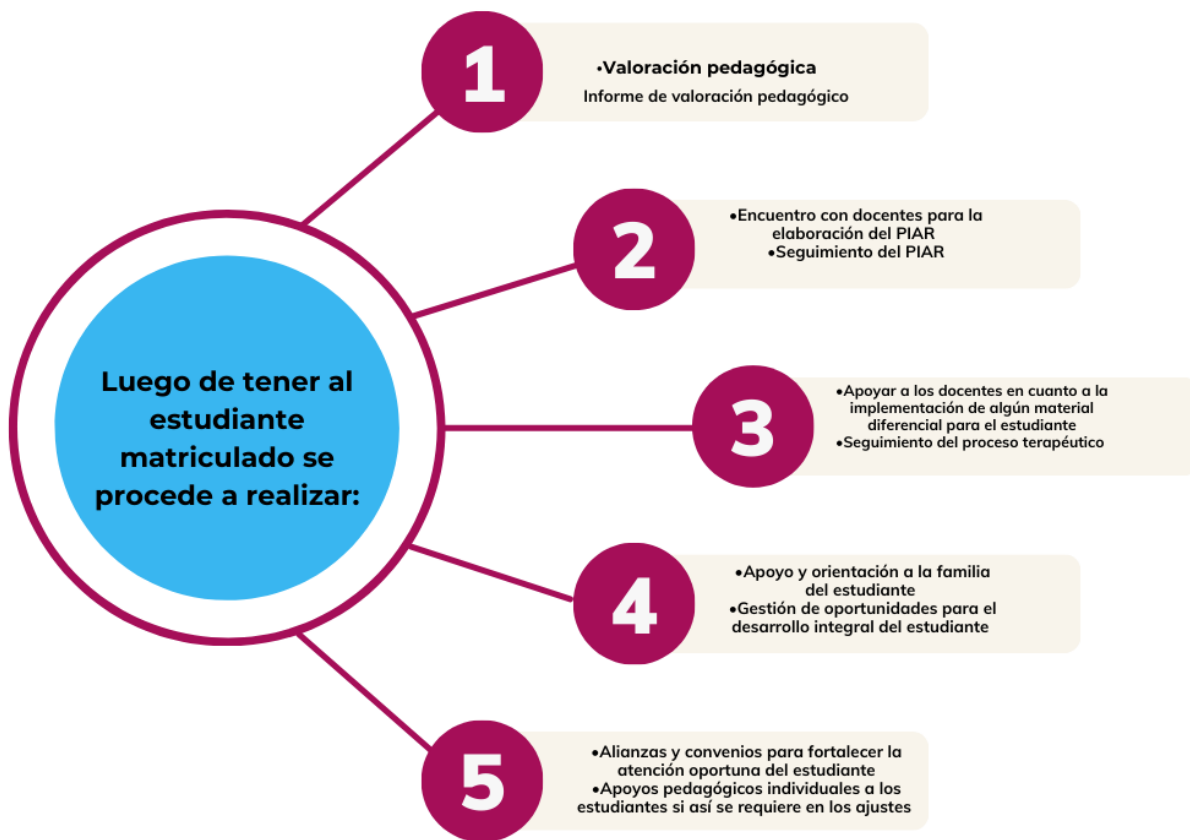
Imagen 2: Ruta de atención en el proceso de educación inclusiva (elaboración propia)

En resumen, se establece un proceso claro para garantizar la atención adecuada de estudiantes con discapacidad y talentos excepcionales, involucrando a diversas entidades y siguiendo una ruta definida para la valoración y atención apropiada.