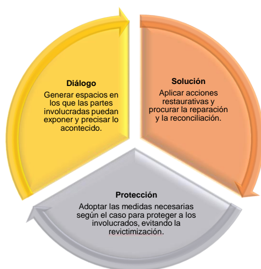
Imagen 5: Momentos para la atención de las situaciones de convivencia (elaboración propia).

En todas las situaciones de convivencia se tendrán en cuenta los siguientes momentos