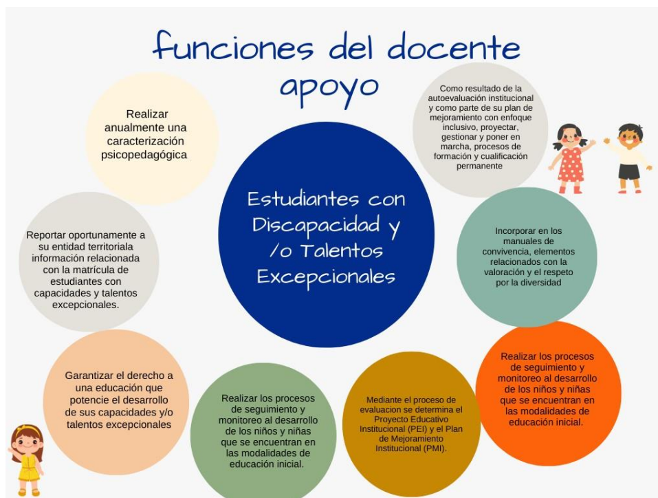
Imagen 1: Funciones del docente de apoyo (elaboración propia).