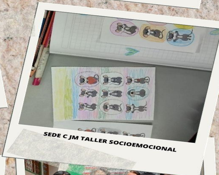
SEDE C JM TALLER SOCIOEMOCIONAL