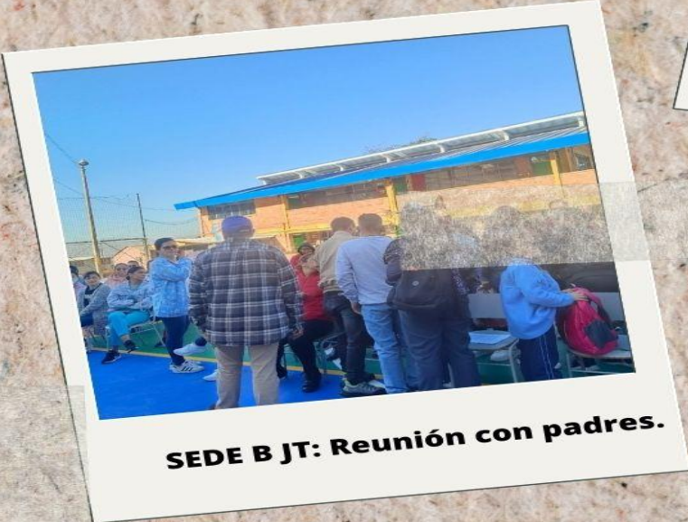
SEDE B JT: Reunión con padres.