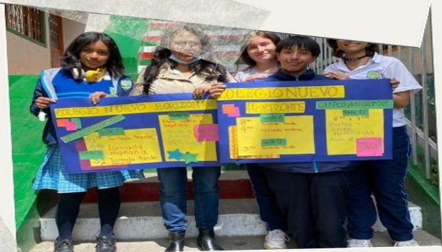
ESPECIAL: Perifoneo para matrículas nuevas.