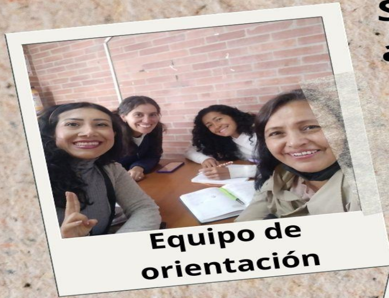
Equipo de orientación