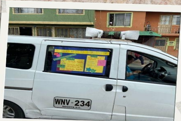
Apoyo de la Asociación Distrital de Educadores y docentes en Comisión