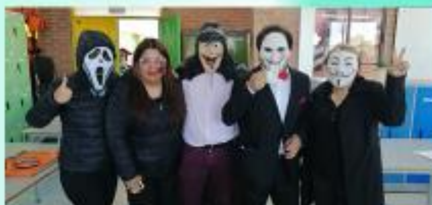
Halloween 2022, sala de profesores