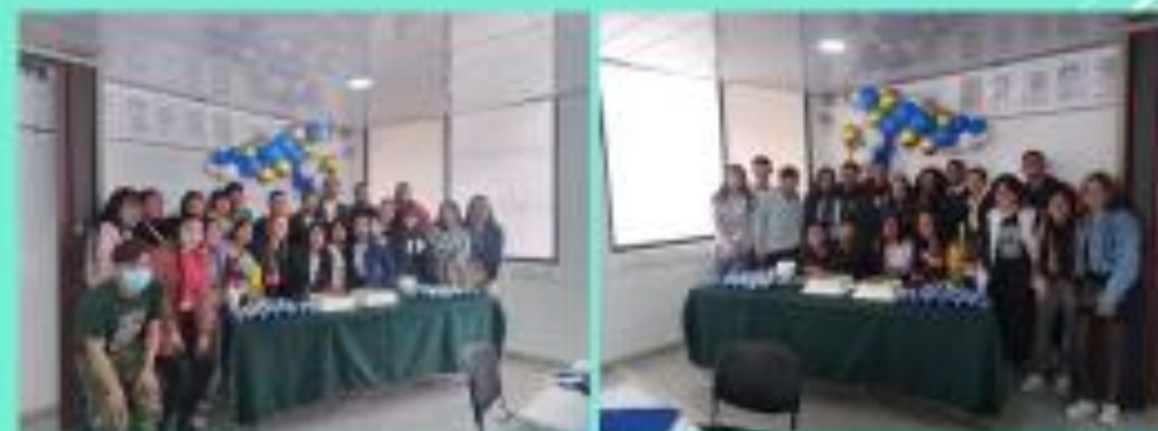
Bachilleres 2023, homenaje de despedida