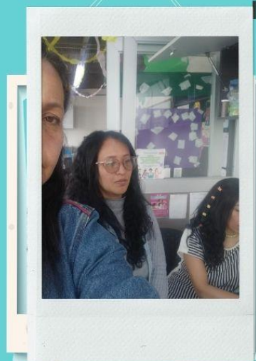
Reunión equipo PES sede C

Taller de emociones sedes b y c, empalme Orientadora sede B cursos 402,403,591,502,503. En la sede C, reunión proyecto de educación sexual, elaboración de guía de género, taller sobre las emociones