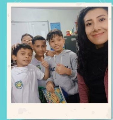
Taller socio emocional. sede B Reunión orientadoras

Taller de emociones sedes b y c, empalme Orientadora sede B cursos 402,403,591,502,503. En la sede C, reunión proyecto de educación sexual, elaboración de guía de género, taller sobre las emociones