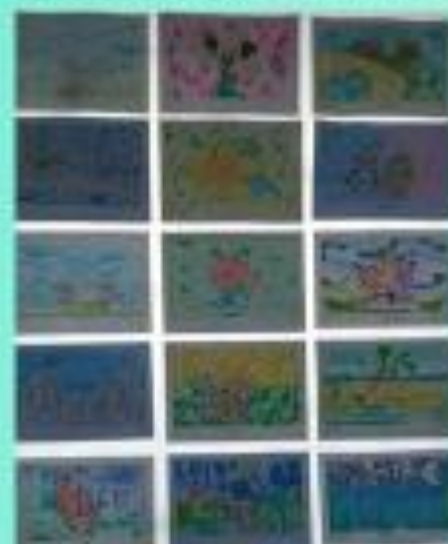
Muestra artística 2023

Cada uno de los miembros de la comunidad educativa, tiene la posibilidad de aportar con sus acciones en el propósito de hacer uso adecuado del informe parcial intermedio, para el mejoramiento académico, procurando una baja reprobación de asignaturas al cierre del primer período, que será el próximo 03 de mayo. Restan tan solo 06 semanas para ello y por eso invito a padres, madres, docentes y a los mismos estudiantes, para que enfoquen sus esfuerzos en la consecución del logro.