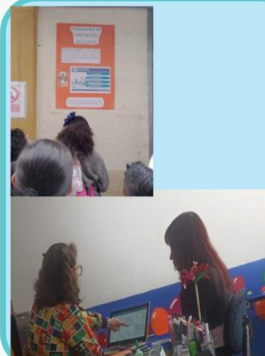
Atención familiar y a comunidad.