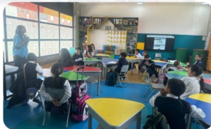
SEMILLERO DE HUERTAS ESCOLARES PARA LA VIDA SEDE C