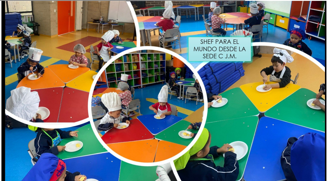
SHEF PARA EL MUNDO DESDE LA SEDE C J.M.