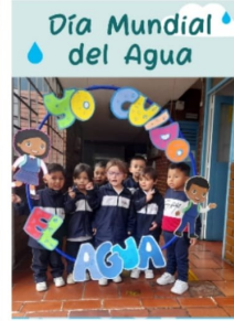
Día Mundial del Agua