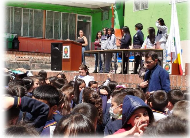
Registro del debate jornada mañana y tarde, en ese mismo orden de izquierda a derecha.

Como era de esperarse, el debate suscitó muchas emociones, reflexiones individuales y colectivas, sentires e inclinaciones y es de señalar que una de las candidatas a contraloría no pudo asistir al debate en la jornada mañana, lo cual dejó mal parada a su compañera candidata a personería, además de que se presentó una candidatura a personería por curso, y en nuestro colegio Provincia de Quebec tenemos dos onces en la mañana y uno en la tarde. Y no es difícil concluir que para la jornada de la mañana los sentimientos, las ideas y por supuesto, los votos quedarían divididos, por ello, debían ganarse afectos y apoyo en la jornada contraria, pero también se debe señalar, que la candidata de la tarde y su fórmula a contraloría destacaron notoriamente en los dos debates y en especial, en el de la tarde, aunque la plancha número 3 destacó en el debate de su jornada, en la mañana. Pero definitivamente el carisma, el convencimiento y la capacidad argumentativa de la plancha número 2 quedaron en el aura de la campaña y en el concluyente debate.