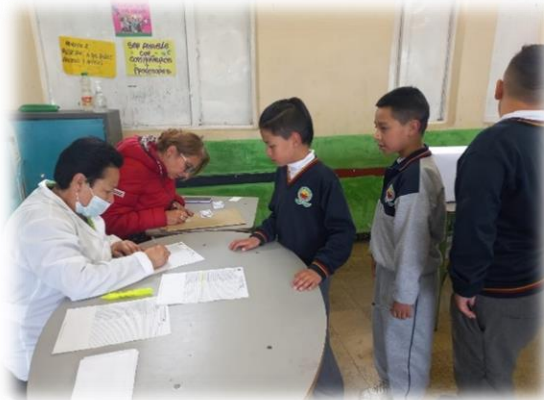
Registro de la Fiesta Democrática y del escrutinio.