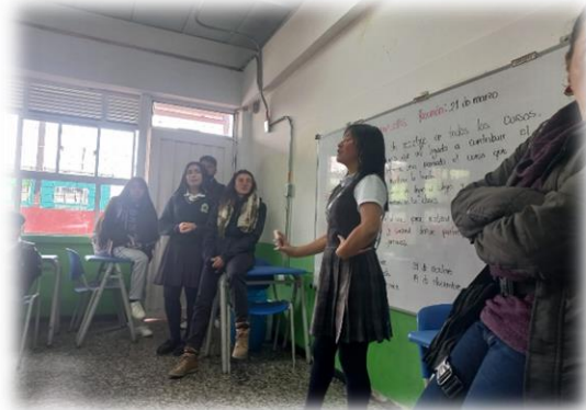
Primer Consejo Estudiantil. Fotografías del Campo Histórico

Queremos cerrar nuestra presentación acerca de la democracia Quebecista con una reflexión ofrecida el día del debate electoral, por quien sintetiza este proceso mediante este corto escrito: