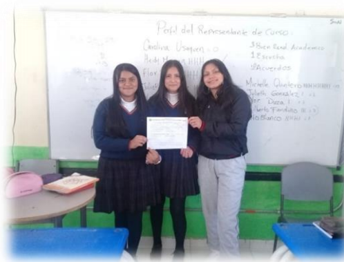
Grado 802: Representante, Vigía y Brigadista.

En esa misma jornada aprovechamos para elegir representantes de curso, vigías ambientales y brigadistas de emergencias por curso, con el acompañamiento de los docentes directores de curso.