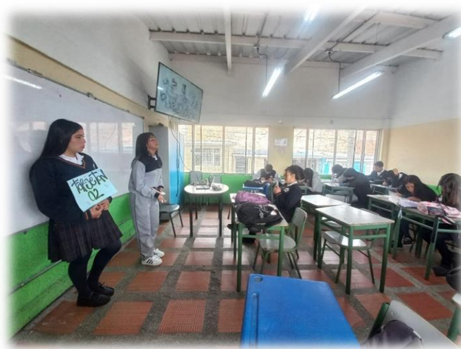
Campaña plancha número dos. Curso 1102 jornada mañana.

Por supuesto se aclaró que la campaña debía basarse en propuestas realizables y acordes a la realidad de la institución y la comunidad educativa, sin lugar para promesas ilógicas ni compromisos personales, de tal manera que no debían ofrecer ningún objeto material, más allá de sus argumentos y capacidad de seducción política y argumentativa. Y así fue, la campaña se desarrolló con transparencia, madurez y en un ambiente de compromiso democrático e institucional, con una sana y digna competencia entre las candidatas. Las propuestas se dividieron en tres ejes, a saber, el eje académico, el convivencial y el ambiental. Se les sugirió a las candidatas resumir sus propuestas en una general para cada eje, de tal manera que solo fueran tres propuestas que se llevaran a cabo en tres tiempos, a corto, mediano y largo plazo.