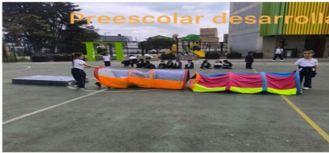
Preescolar desarrolla y fortalece sus talentos