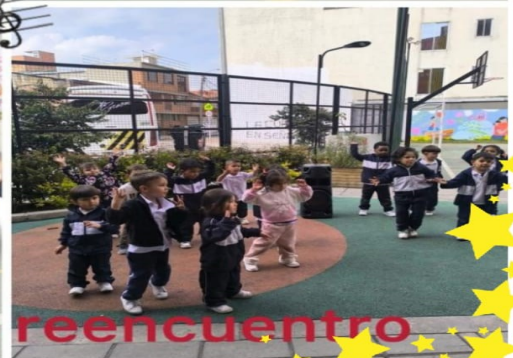
Por un pronto reencuentro