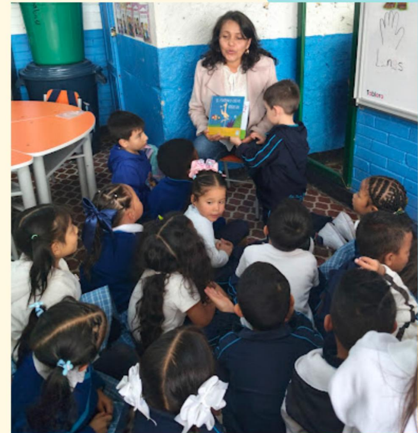
ORIENTACIÓN ESCOLAR SE UNE AL PLAN LECTOR