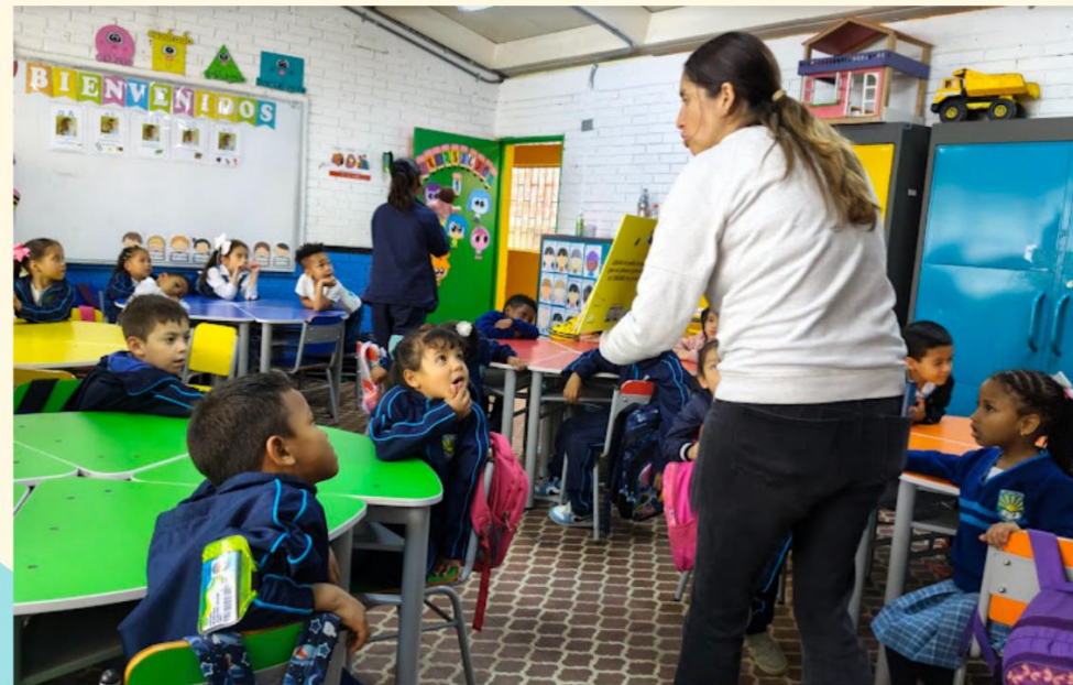
TRABAJO ARTICULADO CON BIBLIOTECA ESCOLAR