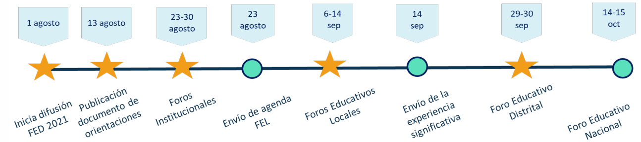
Figura 1. Ruta del foro

A continuación (figura 1), se presentan las fechas proyectadas para la realización del FED de acuerdo con los momentos descritos: